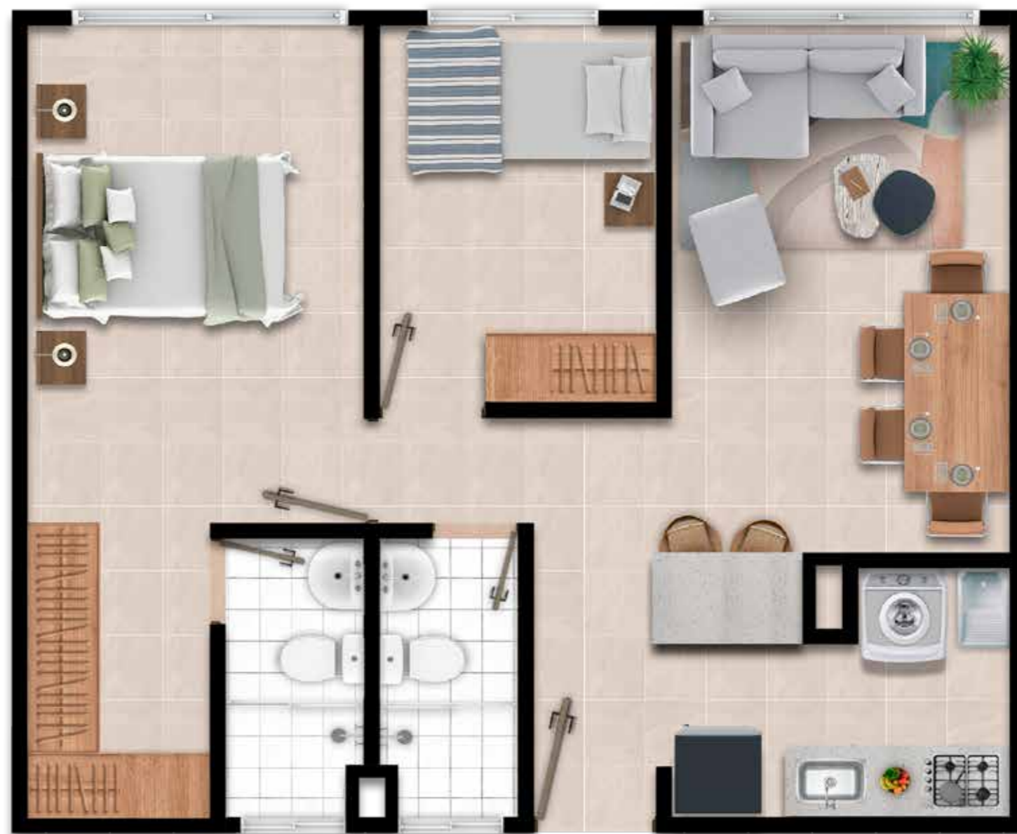
APTO TIPO 3-6-9-12 ÁREA: 48.00 M2