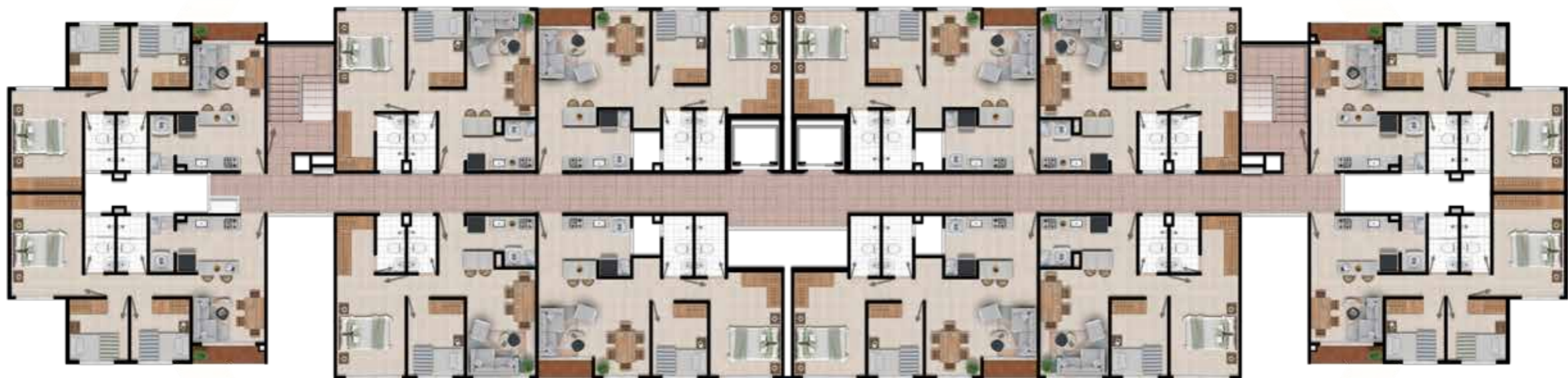
PLANTA SEGUNDO PISO